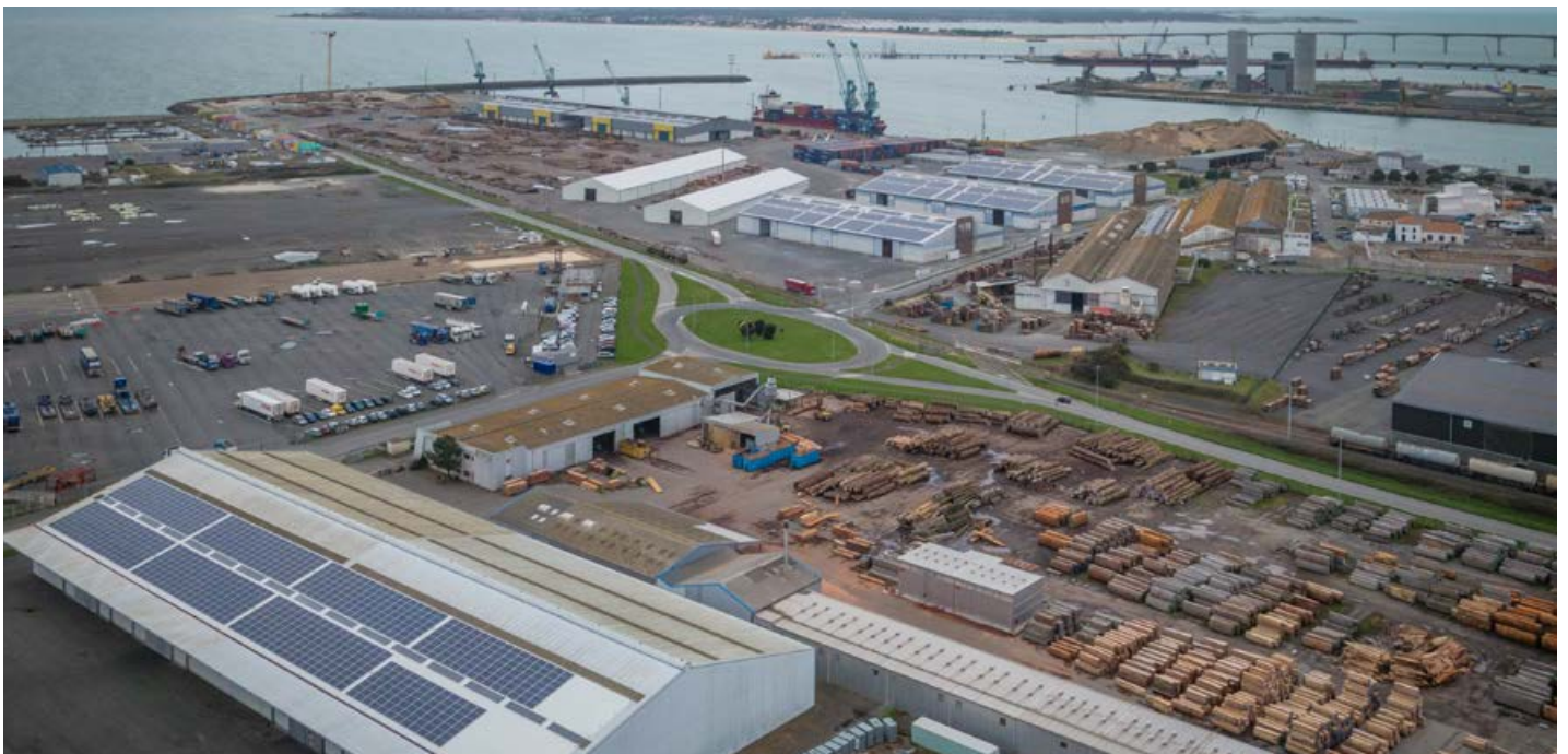
© IEL : Port Atlantique de La Rochelle

Après un peu plus de 5 mois de chantier, la première tranche des travaux de solarisation du Port Atlantique de La Rochelle, portée par le Groupe IEL, vient de se terminer.